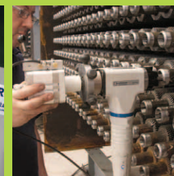
Максимальная мощность при малом весе.