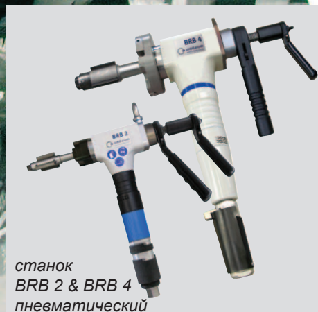
станок BRB 2 & BRB 4 пневматический