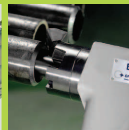
Точная и воспроизводимая подготовка швов соединений труб и трубных решеток.