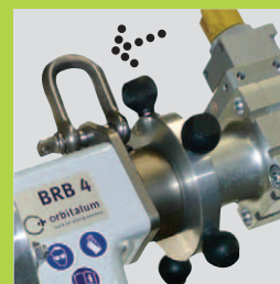
Крепление для сбалансированного манипулятора обеспечивает быструю и не требующую усилий обработку.