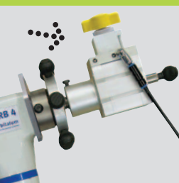
BRB пневмо/авто с пневматическим зажимом, идеален для серийной обработки!