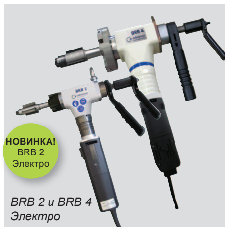
BRB 2 и BRB 4 Электро