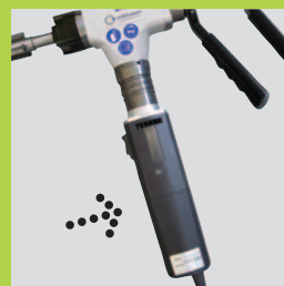
В будущем будут выпущены электроверсии оптимизированного электродвигателя, а также станка BRB 2.